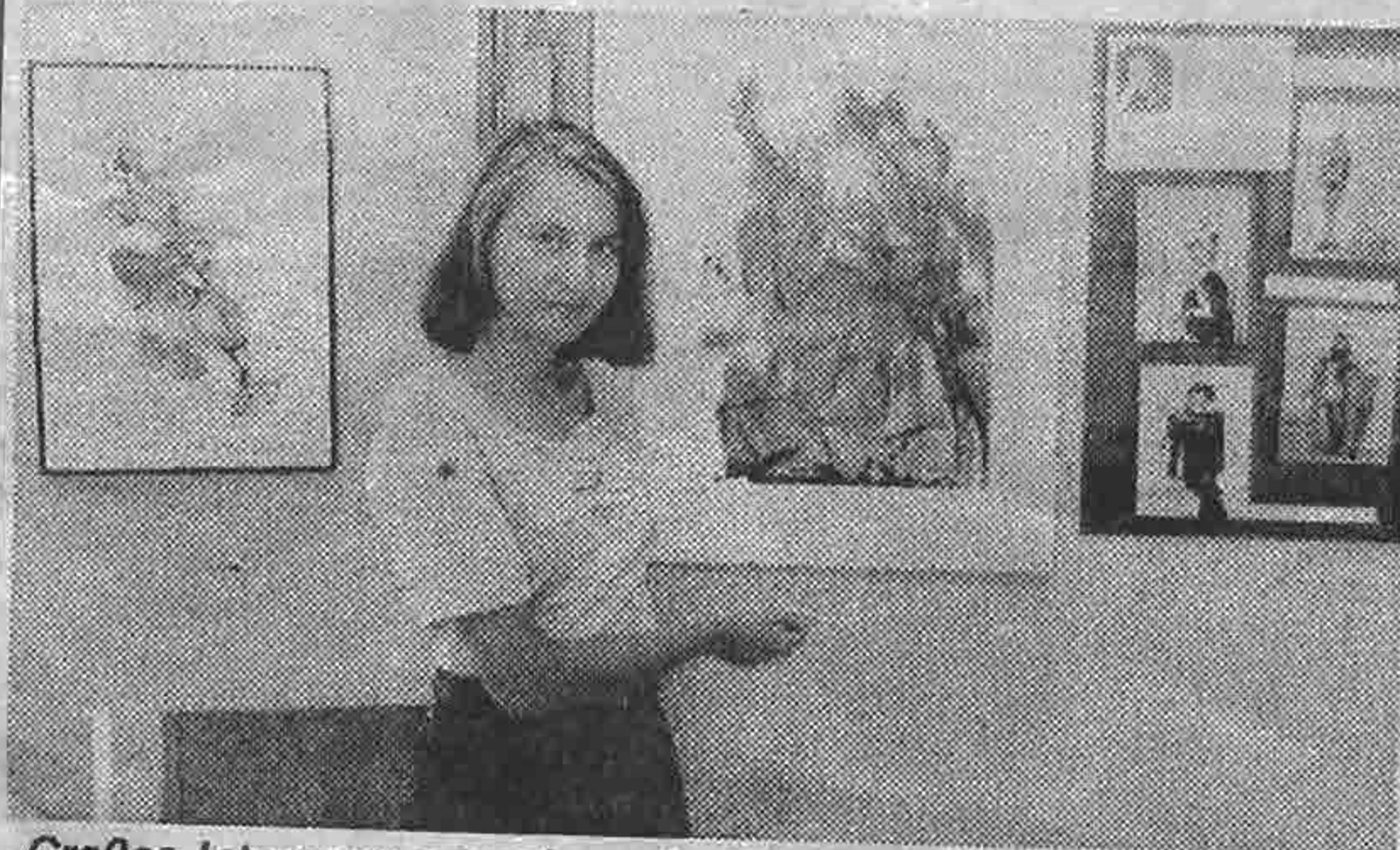
Großes Interesse erwecken die Werke von Gisela Preuler, die bis September in der Raiffeisenkasse zu sehen sind.